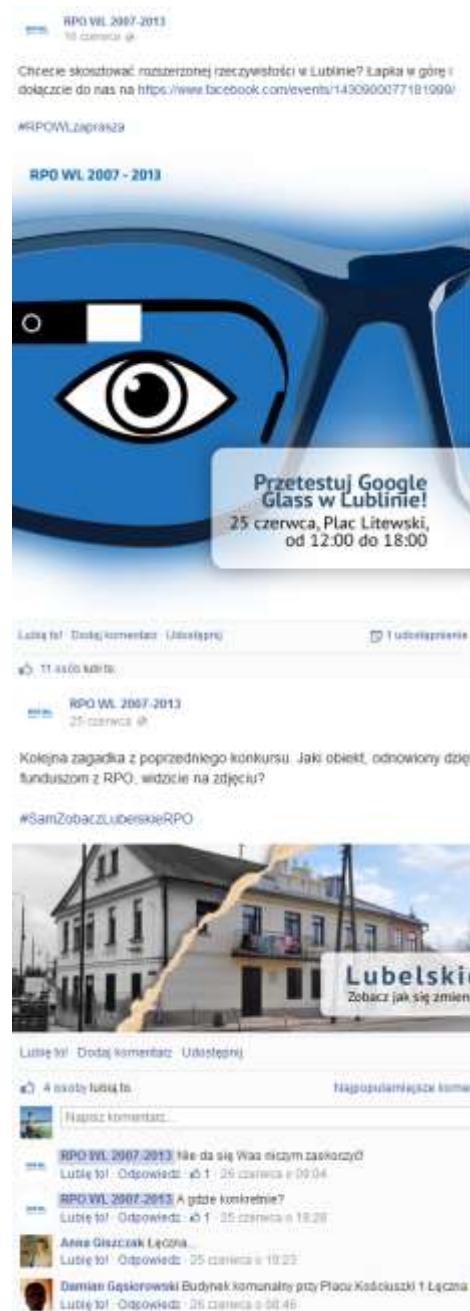
Działania prowadzone na portalu Facebook.

Obok ww. działań wydrukowano 9 tys. plakatów (6 wariantów) dotyczących kampanii, które rozesłane zostały do Urzędów gmin i powiatów województwa lubelskiego.