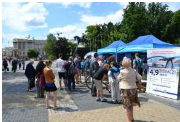
Jeden z niestandardowych elementów kampanii RPO WL w 2014 roku: Event na Placu Litewskim w Lublinie pn. Przetestuj Google Glass w Lublinie!

Warto podkreślić, że IZ RPO WL zobowiązała Wykonawcę do opracowania tzw. Key Visual, który stanowił background w realizacji działań wspomagających kampanię, pozostałych niezależnych od kampanii działań informacyjno-promocyjnych, w tym także druków (folderach, katalogach, terminarzach itd.) oraz gadżetów.