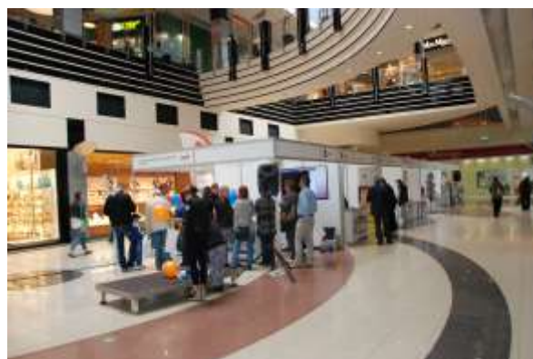
II edycja Targów dla przedsiębiorczych odbyła się 30 maja 2014 roku w Galerii Olimp w Lublinie.

Odwiedzający targi z zainteresowaniem przyglądali się ofercie wystawców. Byli ciekawi możliwości pozyskania dofinansowania na rozwój firm. Świadczyły o tym liczne pytania o warunki takiego wsparcia. Społeczeństwo jest świadome, że to właśnie rozwój przedsiębiorczości jest ogromną szansą dla województwa lubelskiego.