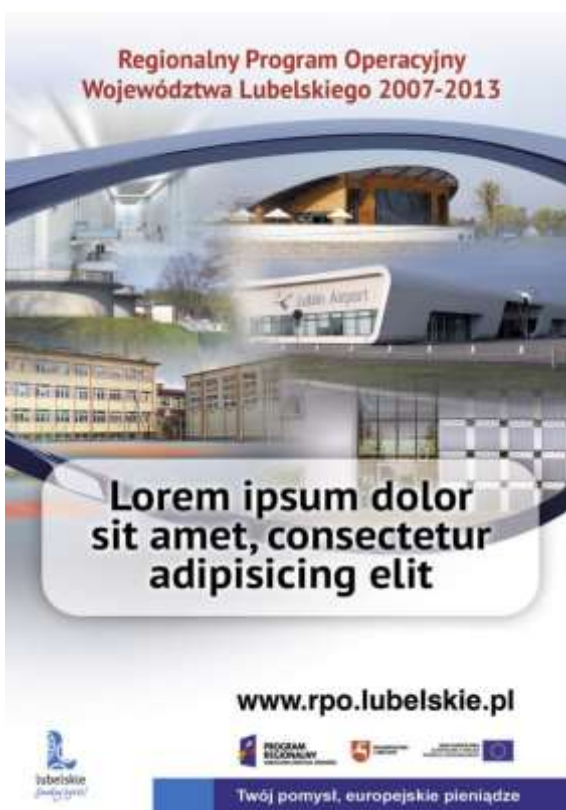
Wersja podstawowa oraz alternatywna Key Visual kampanii.