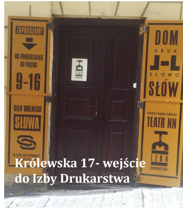
Królewska 17- wejście do Izby Drukarstwa

Projekt współfinansowany ze środków Europejskiego Funduszu Rozwoju Regionalnego w ramach Regionalnego Programu Operacyjnego Województwa Lubelskiego na lata 2007-2013