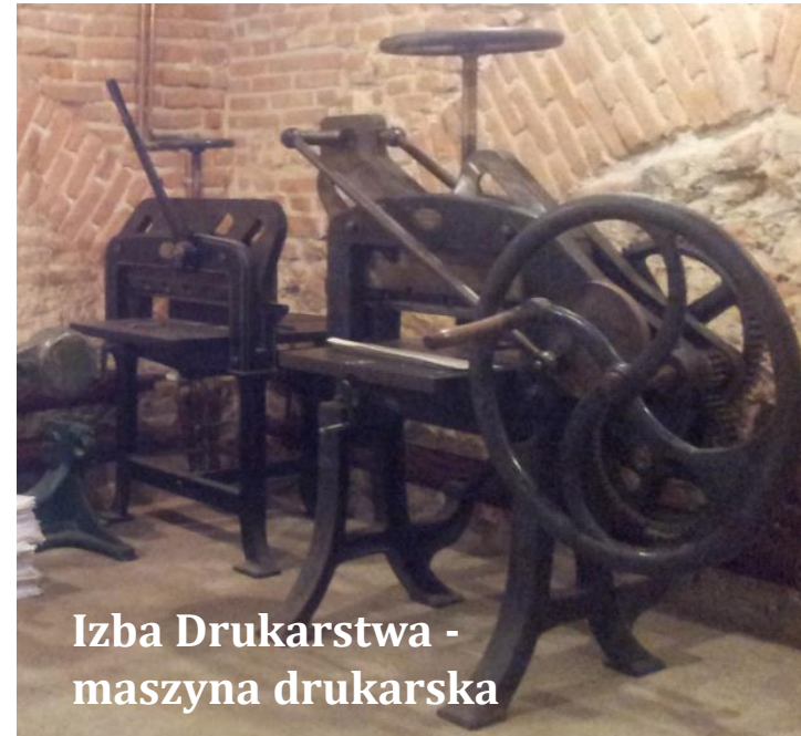
Izba Drukarstwa - maszyna drukarska

Projekt współfinansowany ze środków Europejskiego Funduszu Rozwoju Regionalnego w ramach Regionalnego Programu Operacyjnego Województwa Lubelskiego na lata 2007-2013