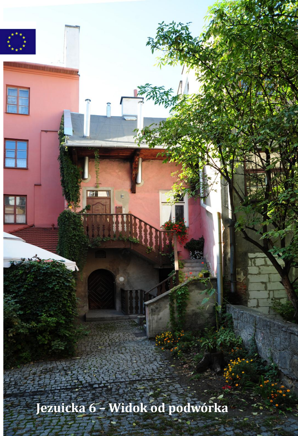
Jezuicka 6 – Widok od podwórka

Projekt współfinansowany ze środków Europejskiego Funduszu Rozwoju Regionalnego w ramach Regionalnego Programu Operacyjnego Województwa Lubelskiego na lata 2007-2013