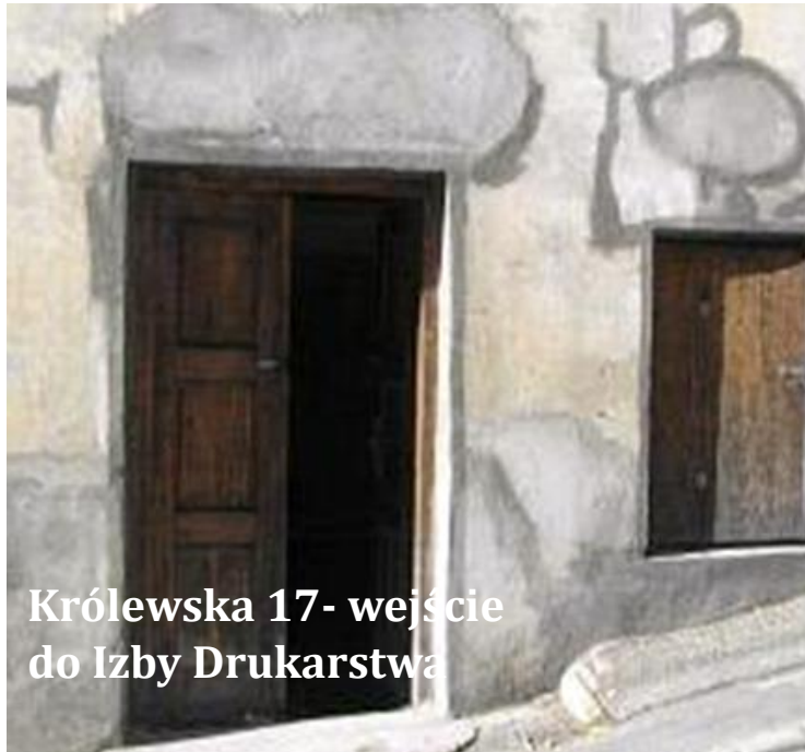
Królewska 17- wejście do Izby Drukarstwa