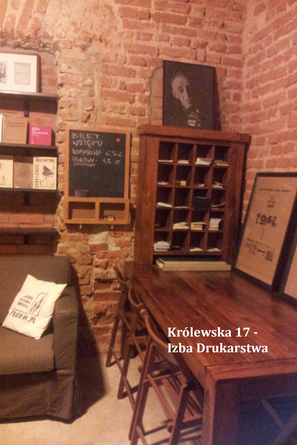
Królewska 17 - Izba Drukarstwa