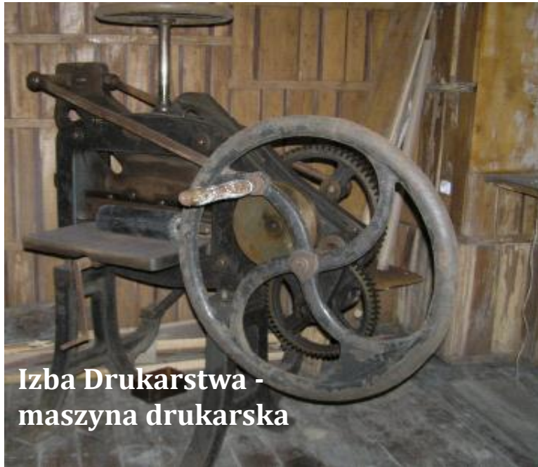
Izba Drukarstwa - maszyna drukarska