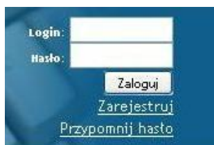
Rys. 3. Pole logowania.

Po poprawnym zalogowaniu się do systemu pojawiają się zakładki umożliwiające beneficjentom wypełnienie wniosków o dofinansowanie i o płatność (Rys. 4.). W ramach e-LSI można także zobaczyć ogłoszone konkursy, zmienić dane beneficjenta, dane osoby wypełniającej wniosek, dokonać zmiany hasła, odczytać informacje od systemu. Widoczne są kolejno od lewej strony zakładki: „START”, „GENERATOR WNIOSKÓW”, „KONKURSY”, „WIADOMOŚCI”, „DANE” oraz „WYLOGUJ SIĘ”.