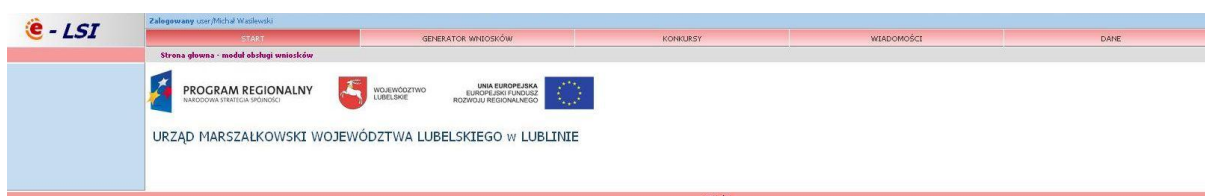
Rys. 4. Wygląd systemu e-LSI po zalogowaniu.

Po poprawnym zalogowaniu się do systemu pojawiają się zakładki umożliwiające beneficjentom wypełnienie wniosków o dofinansowanie i o płatność (Rys. 4.). W ramach e-LSI można także zobaczyć ogłoszone konkursy, zmienić dane beneficjenta, dane osoby wypełniającej wniosek, dokonać zmiany hasła, odczytać informacje od systemu. Widoczne są kolejno od lewej strony zakładki: „START”, „GENERATOR WNIOSKÓW”, „KONKURSY”, „WIADOMOŚCI”, „DANE” oraz „WYLOGUJ SIĘ”.