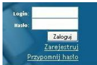
Rys. 3. Pole logowania.

Po wpisaniu tych danych należy kliknąć lewym przyciskiem myszy w przycisk „Zaloguj” (Rys 3.).