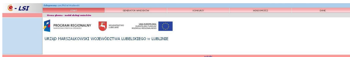
Rys. 4. Wygląd systemu e-LSI po zalogowaniu.

Po poprawnym zalogowaniu się do systemu pojawiają się zakładki umożliwiające beneficjentom wypełnienie wniosków o dofinansowanie i o płatność (Rys. 4.). W ramach e-LSI można także zobaczyć ogłoszone konkursy, zmienić dane beneficjenta, dane osoby wypełniającej wniosek, dokonać zmiany hasła, odczytać informacje od systemu. Widoczne są kolejno od lewej strony zakładki: „START”, „GENERATOR WNIOSKÓW”, „KONKURSY”, „WIADOMOŚCI”, „DANE” oraz „WYLOGUJ SIĘ”.