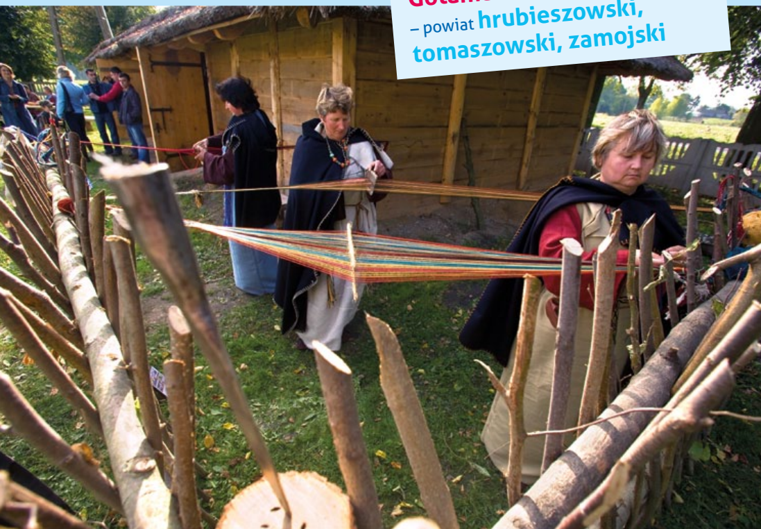
Gotania – festiwal kultury antycznej – powiat hrubieszowski, tomaszowski, zamojski