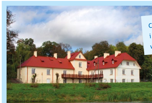
Centrum Kultury i Promocji Gminy w Strzyżewicach