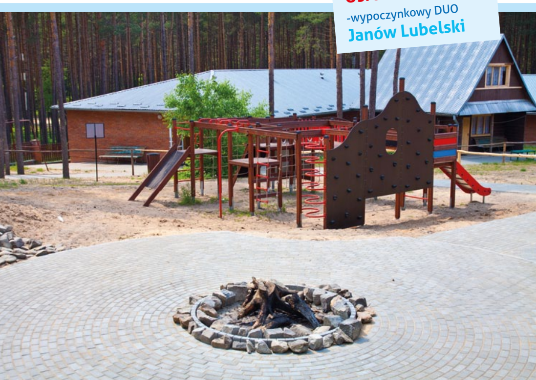
Ośrodek edukacyjno- -wypoczynkowy DUO Janów Lubelski