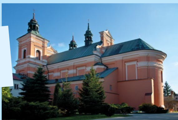
Remont zabytkowego Kościola OO. Bernardynów w Radecznicy