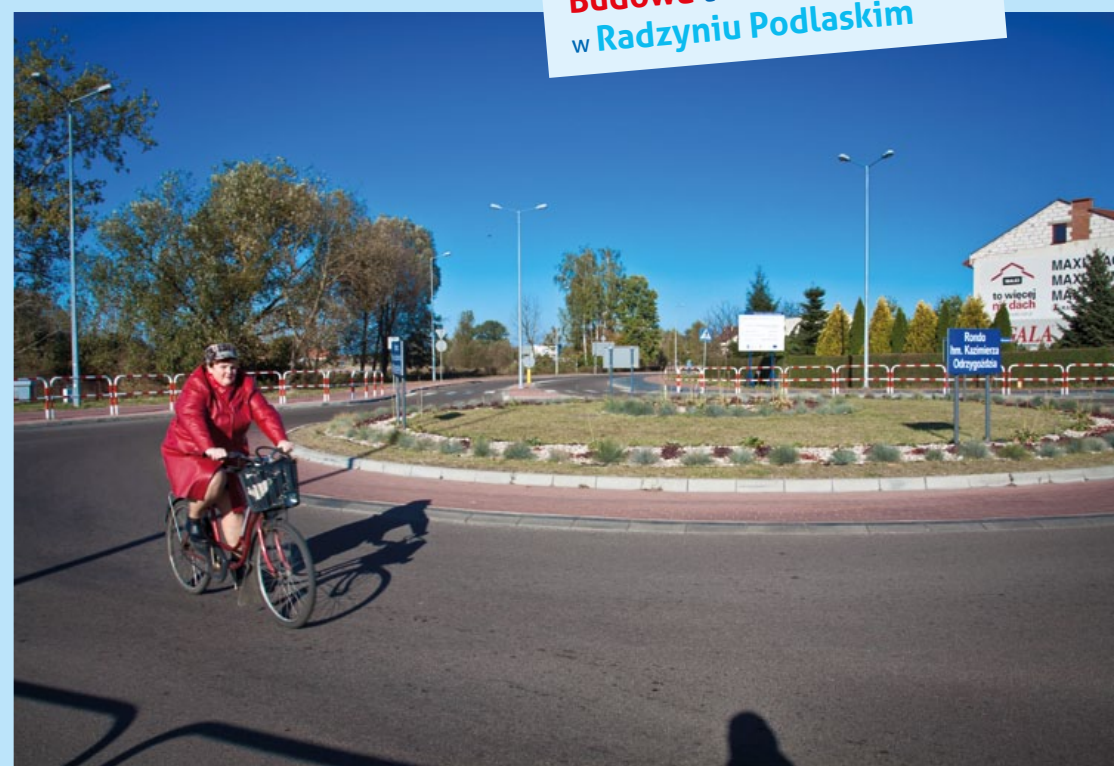
Budowa ul. Konstytucji 3-go Maja w Radzynie Podlaskim