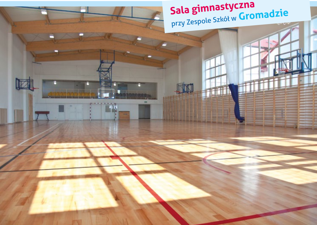
Sala gimnastyczna przy Zespole Szkół w Gromadzie