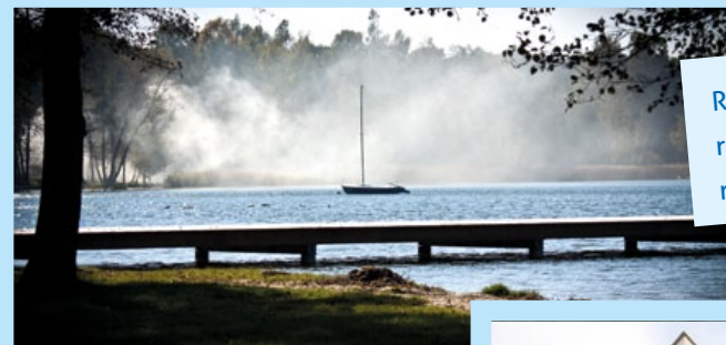
Rozbudowa ośrodka rekreacyjnego nad jeziorem Firlej