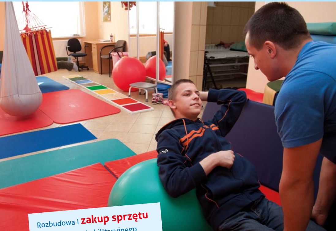
Rozbudowa i zakup sprzętu do Ośrodka Rehabilitacyjnego w Tomaszowie Lubelskim