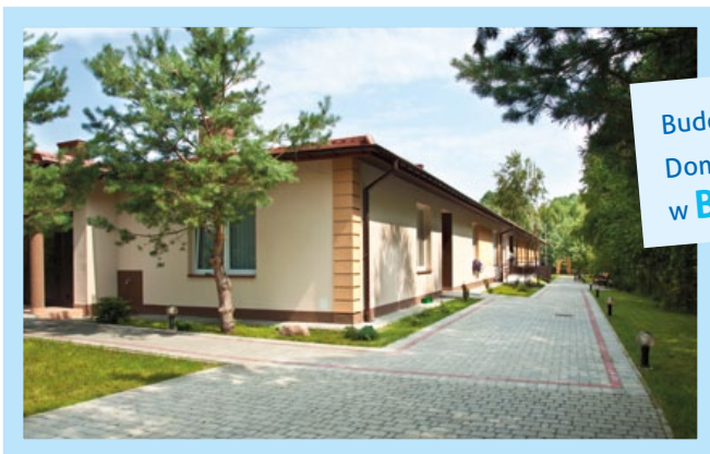
Budowa i wyposażenie Domu Pomocy Społecznej w Baranówce