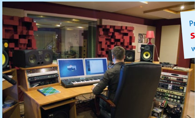
Profesjonalne studio nagrań w Chetmie