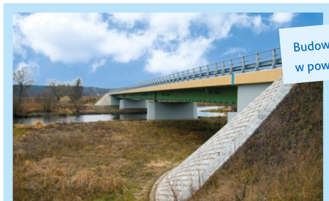
Budowa dróg i mostu w powiecie białskim