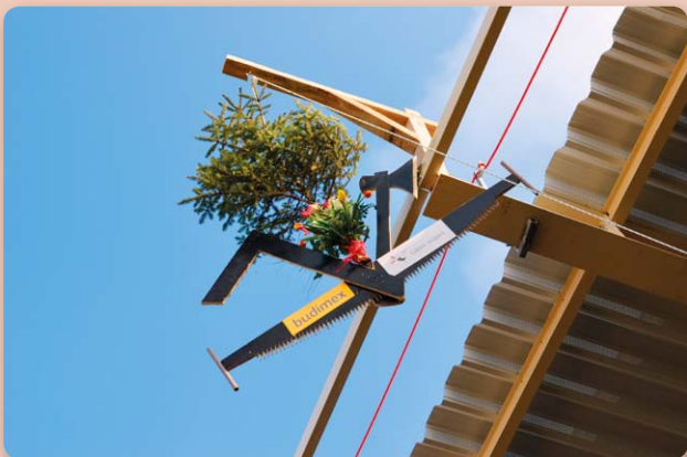
Fot. Wiecha pod dachem terminalu w Świdniku