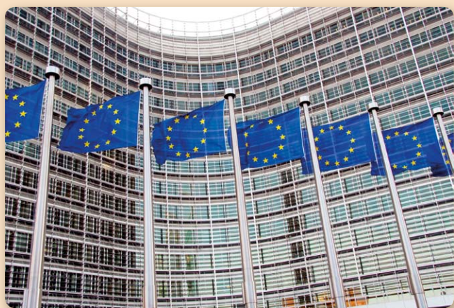
Zaprezentowanie przez Komisję Europejską pakietów rozporządzeń nt. funduszy w latach 2014–2020 rozpoczęło gorącą debatę nad nową polityką spójności Unii Europejskiej

służyć także szersze zastosowanie mechanizmów warunkowości oraz uproszczony system wdrażania funduszy.