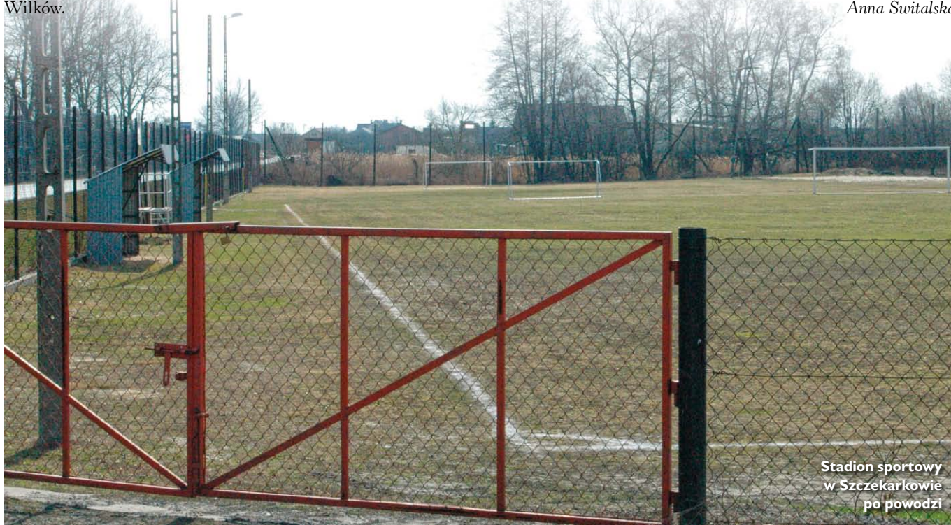
Stadion sportowy w Szczekarkowie po powodzi