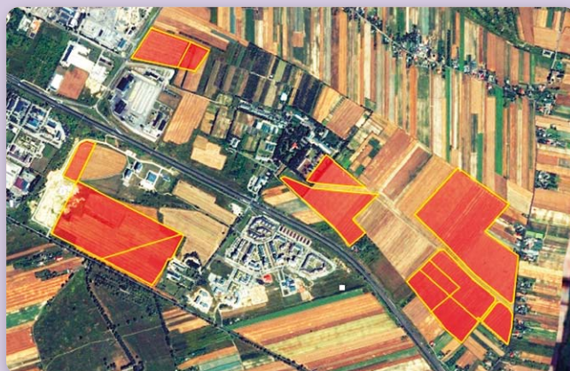
Strefa ekonomiczna w Lublinie, jeden z 11 projektów, które otrzymały wsparcie z Regionalnego Programu Operacyjnego na uzbrojenie i tworzenie terenów inwestycyjnych w województwie lubelskim

uzbrojenia terenów inwestycyjnych niezbędnych dla funkcjonowania podstrefy ekonomicznej, będącej częścią Tarnobrzelskiej Specjalnej Strefy Ekonomicznej EURO-PARK WISŁOSAN. Największą bolączką dotyczącą funkcjonowania terenów inwestycyjnych jest brak kanalizacji sanitarnej. W efekcie inwestowanie w Tomaszowie Lubelskim jest droższe i mniej atrakcyjne niż w innych miejscach w regionie. Sytuację pogarsza zły stan dróg wewnętrznych. Otrzymane środki z Regionalnego Programu Operacyjnego pozwolą na wybudowanie 1,5 km odcinka sieci kanalizacji sanitarnej oraz remont odcinka drogi wewnętrznej na terenie podstrefy ekonomicznej przy ul. Łaszczowieckiej. Dodatkowo w północnej części podstrefy pojawi się ogrodzenie.