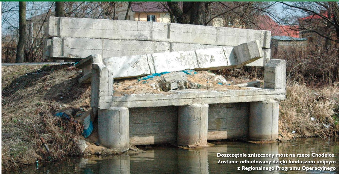
Doszczętnie zniszczony most na rzece Chodelce. Zostanie odbudowany dzięki funduszom unijnym z Regionalnego Programu Operacyjnego

powodzi, urzędnicy i mieszkańcy starają się pozyskiwać środki na inne inwestycje.