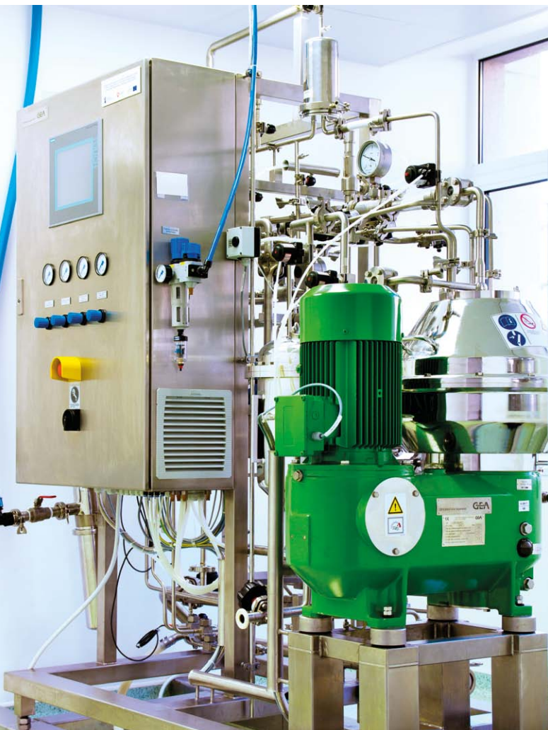
Wirówka przepływowa, służąca do koncentracji bakterii. Wyposażona jest w innowacyjną metodę odciągania wody. Urządzenie wykorzystywane jest na świecie zaledwie od 4 lat. W naszym kraju posiada je tylko Biomed

Jak wygląda walka o certyfikat? Co należy wdrożyć żeby jakość produktów sięgnęła światowych standardów? – Należy spełniać ściśle wymogi podane w rozporządzeniu w sprawie Dobrych Praktyk Wytwarzania z 2008 r. Przed otrzymaniem certyfikatu, każdego producenta wizytuje kontrola z Głównego Inspektoratu