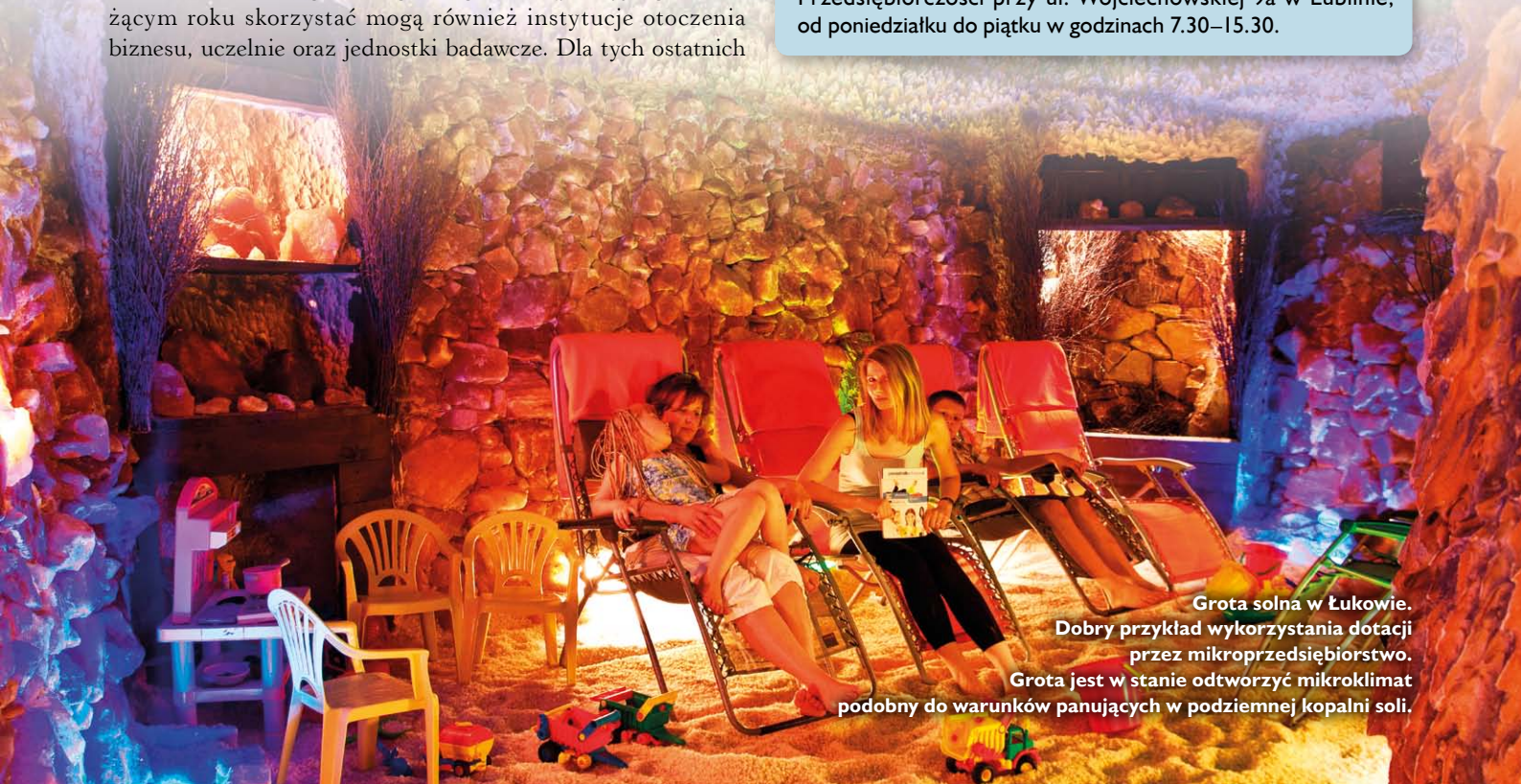
Grotta solna w Łukowie. Dobry przykład wykorzystania dotacji przez mikroprzedsiębiorstwo.

Na pytania odpowiadają też konsultanci Punktu Informacyjnego LAW P pod nr. tel.: 81 462 38 31 i 81 462 38 12 lub osobiście w siedzibie Lubelskiej Agencji Wspierania Przedsiębiorczości przy ul. Wojciechowskiej 9a w Lublinie, od poniedziałku do piątku w godzinach 7.30–15.30.