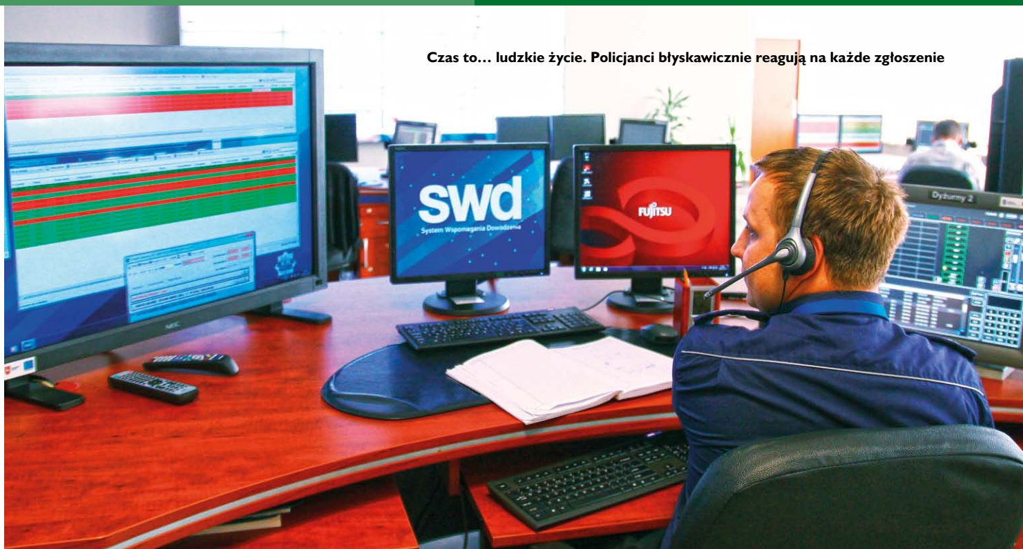
Czas to... ludzkie życie. Policjanci błyskawicznie reagują na każde zgłoszenie