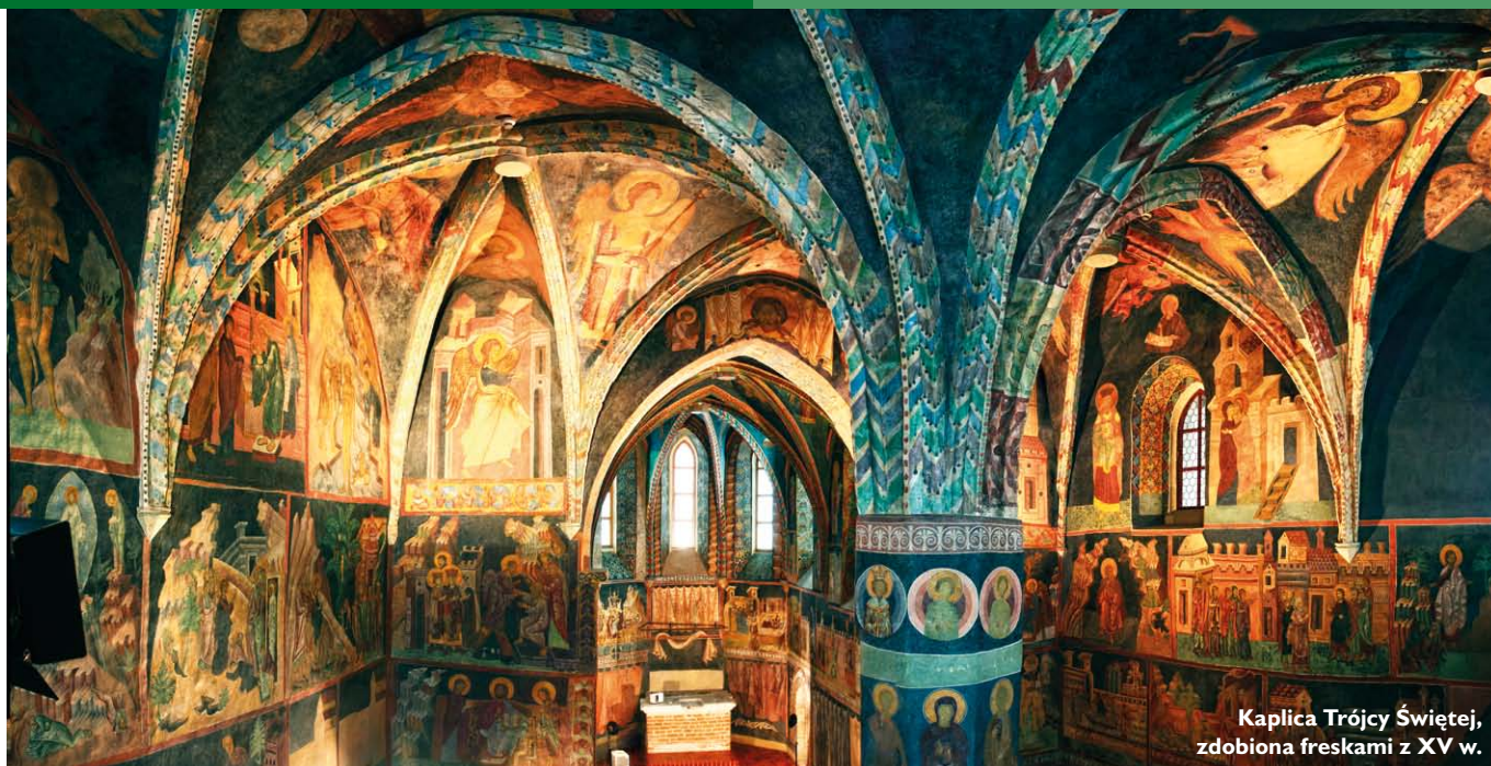
Kaplica Trójcy Świętej, zdobiona freskami z XV w.