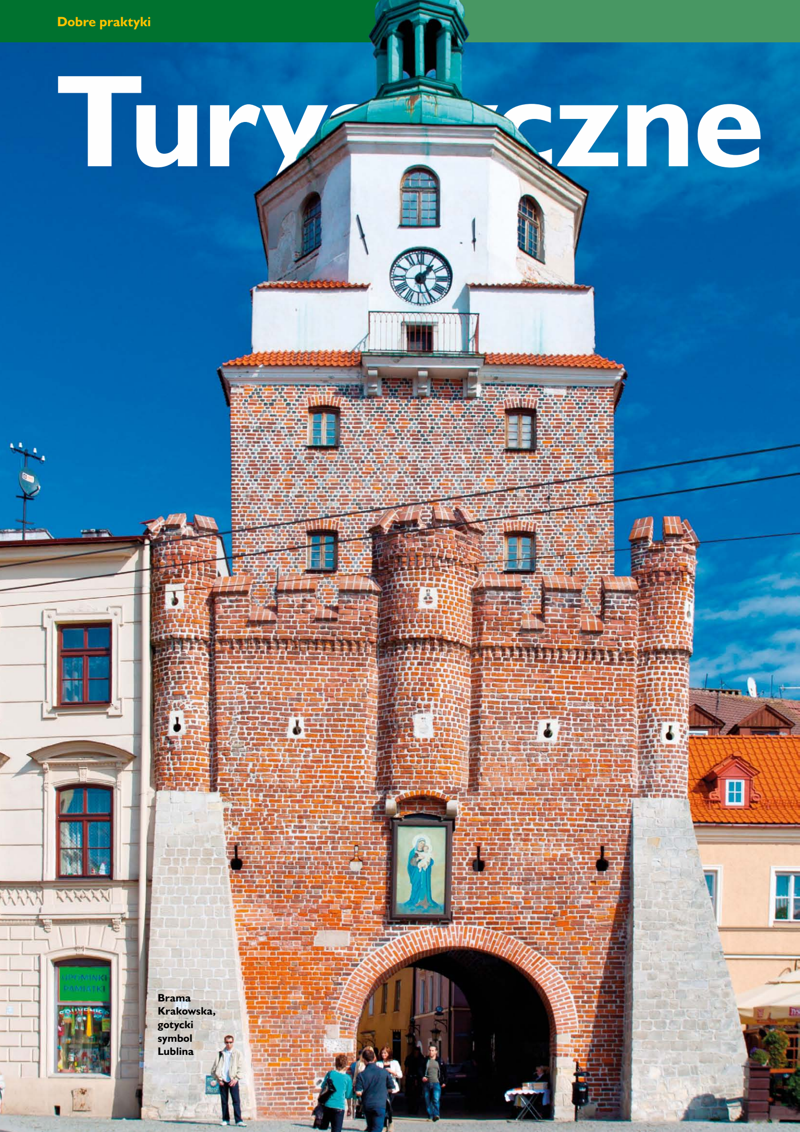
Brama Krakowska, gotycki symbol Lublina