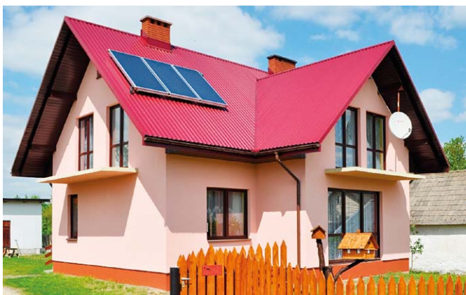
Baterie słoneczne na jednym z domów w gminie Biłgoraj

stwie „Dolina Zielawy” zainwestowało w energię odnawialną z pomocą funduszy unijnych. Na 14 budynkach publicznych i 911 gospodarstwach domowych zamontowano kolektory słoneczne. Samorządowcy przyznają, że wysokie koszty utrzymania istniejących instalacji ciepłych oraz ich zły stan techniczny były istotną barierą dla rozwoju agroturystyki w północnej części województwa lubelskiego.