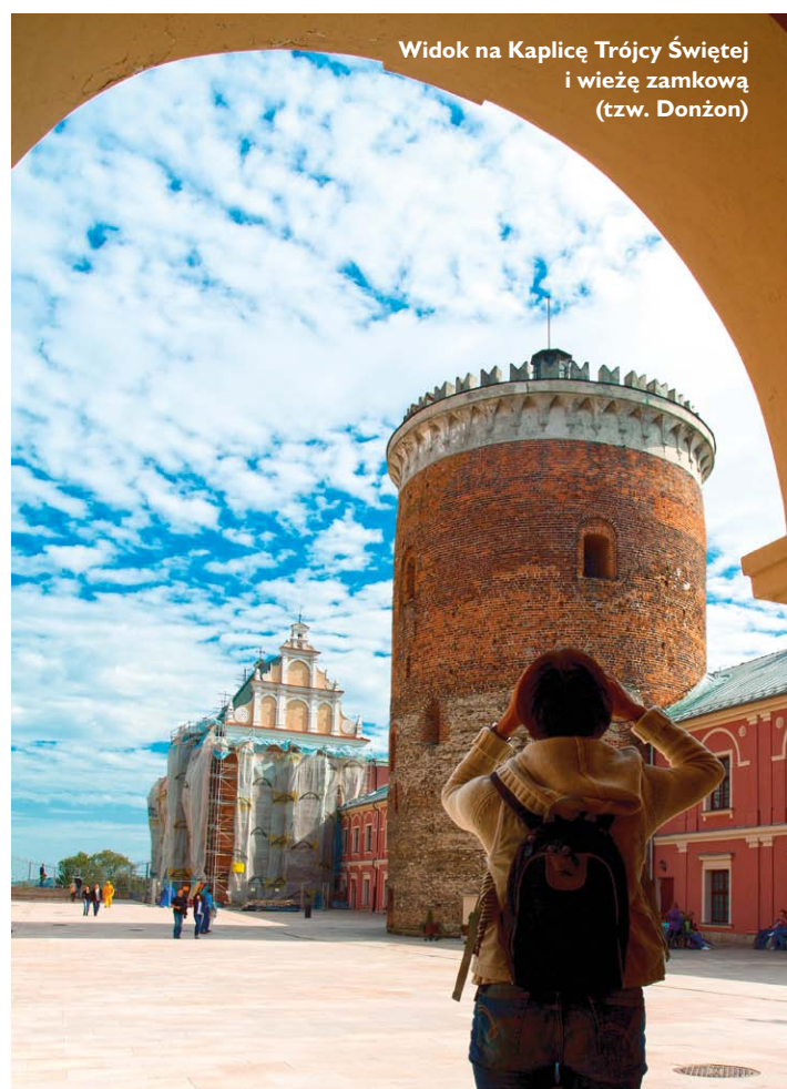
Widok na Kaplicę Trójcy Świętej i wieżę zamkową (tzw. Donjon)