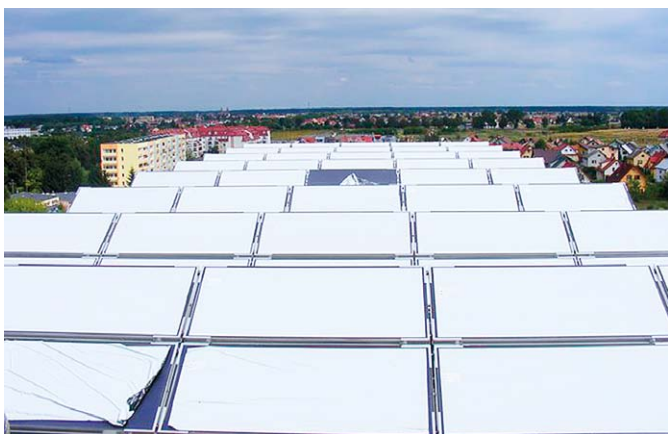
Solary na dachu szpitala w Radzynie Podlaskim tuż po zamontowaniu

Obok indywidualnych odbiorców z „zielonej energii” równie chętnie korzystają instytucje publiczne. Jedną z nich jest szpital w Radzynie Podlaskim. Przy okazji remontu i termomodernizacji budynków SP ZOZ na dachu obiektu zamontowano kolektory.