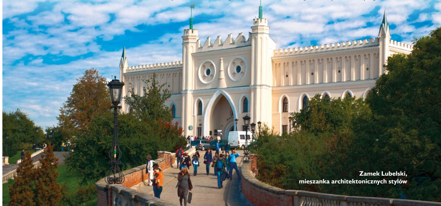
Zamek Lubelski, mieszanka architektonicznych stylów

Muzeum Lubelskie bardzo szybko dostrzegło zalety funduszy europejskich. Już w 1995 roku, w ramach programu ochrony europejskiego dziedzictwa architektonicznego, pozyskało pierwsze środki, które pozwoliły zakończyć prace kon-