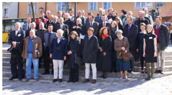
Uczestnicy projektu HerO

rządzenia Dziedzictwem Kulturowym Miasta Lublin ( Cultural Heritage Integrated Management Plan – CHIMP ).