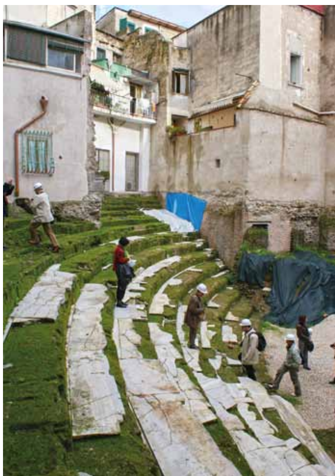
Neapol. Prace przy rekonstrukcji starożytnego amfiteatru

Efektami prac sieci tematycznej HerO było opracowanie przez każde miasto własnego Lokalnego Planu Działań, czyli dokumentu określającego w jaki sposób konkretne miasto chce rozwijać zabytkowe części, nie niszcząc przy tym ich historycznej wartości. Aby umożliwić skuteczny wpływ działań sieci na politykę lokalną, każdy partner projektu musiał utworzyć Lokalną Grupę Wsparcia Urbact. Grupy skupiały instytucje, organizacje i podmioty zainteresowane wymianą doświadczeń w ramach sieci oraz miały pomagać przy opracowywaniu Lokalnego Planu Działania miast uczestniczących w programie. Dodatkowym rezultatem prac sieci HerO było przygotowanie studiów przypadków oraz innych dokumentów doradczych, np. zaleceń i wytycznych. Szczególnie istotnym dokumentem jest Zintegrowany Plan Za-