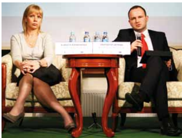
Minister Elżbieta Bieńkowska, marszałek Krzysztof Hetman

Wyjściem z sytuacji mogłaby być zamiana dotychczasowych projektów kluczowych, na inwestycje zintegrowane. – To może być sposób na połączenie rozproszonych środków europejskich i ich koncentrację – podpowiadał Krzysztof Hetman i wskazał na konkrety przykład Kraju Lessowych Wąwozów, gdzie jego zdaniem mógłby funkcjonować projekt zintegrowany, oparty na współpracy kilku podmiotów i finansowany z wielu funduszy. – Samorządy pozyskałyby pieniądze, np. na budowę dróg, które poprawiłyby jakość życia mieszkańców i ułatwiły dostęp do Kraju Lessowych Wąwozów dla turystów i przedsiębiorców. Firmy otrzymałyby fundusze na projekty powodujące rozwój tego obszaru. Natomiast organizacje pozarządowe mogłyby kształcić z Europejskiego Funduszu Społecznego osoby, które miałyby tam pracować – proponował. Według marszałka, zintegrowany projekt sprawdziłby się także na granicy Lublina i Świdnika. Dzięki lotnisku i zmodernizowanej sieci drogowej, mogłaby powstać na tym terenie duża strefa gospodarcza. Innym pomysłem jest realizacja tego typu przedsięwzięć w ramach współpracy transgranicznej, np. Programu Polska–Białoruś–Ukraina, który będzie kontynuowany w latach 2014-2020.