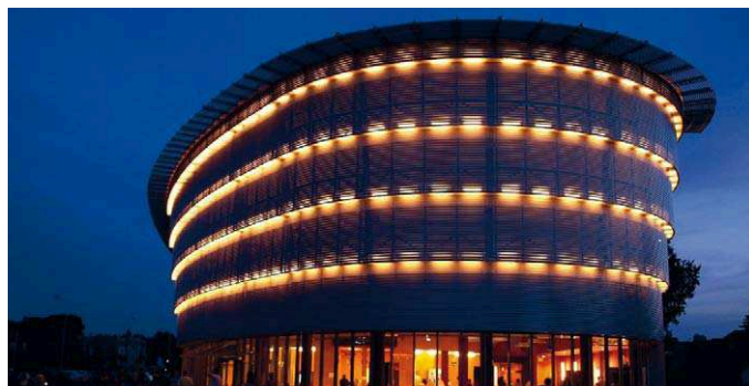
Centrum Kultury Filmowej efektownie prezentuje się nawet w nocy