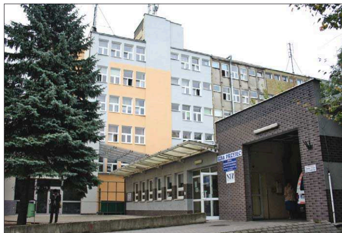
„Somatyk” nie będzie już odstraszał wyglądem

Dzięki unijnym funduszom poprawie ulegnie otoczenie pracy i hospitalizacji pacjentów, personelu medycznego oraz administracji szpitala. Zmniejszą się koszty utrzymania placówki. Zapotrzebowanie