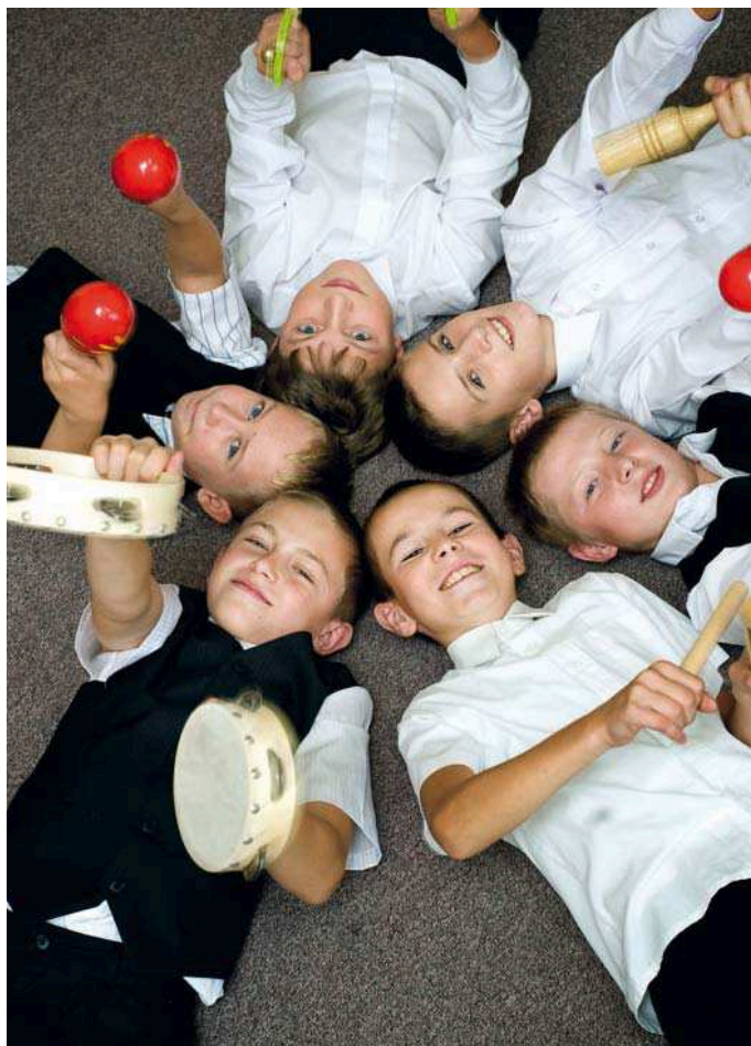
Muzykaoterapia w szkołach, Foto Przemysław Gąbka.

np. hipo- czy dogo-terapia. Przewidziane są też zajęcia rozwijające zainteresowania uczniów szczególnie uzdolnionych, zwłaszcza w zakresie nauk matematyczno-przyrodniczych.