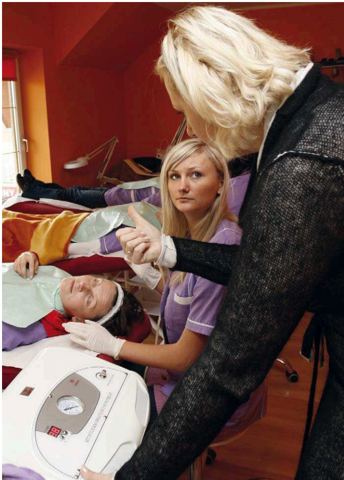
W 2011 znaczna kwota przeznaczona zostanie dla osób zamierzających rozpocząć prowadzenie własnej działalności gospodarczej.

Proces programowania wsparcia na rok 2011 w ramach EFS dobiega już końca. Opracowane przez Instytucję Pośredniczącą projekty Planów działania dla Priorytetów komponentu regionalnego Programu Operacyjnego Kapitał Ludzki są wynikiem uzgodnień z instytucjami zaangażowanymi we wdrażanie Programu, w tym Instytucją Zarządzającą oraz Komisją Europejską. Dokumenty te uwzględniają również sugestie i propozycje zgłoszone w ramach przeprowadzonych konsultacji społecznych.