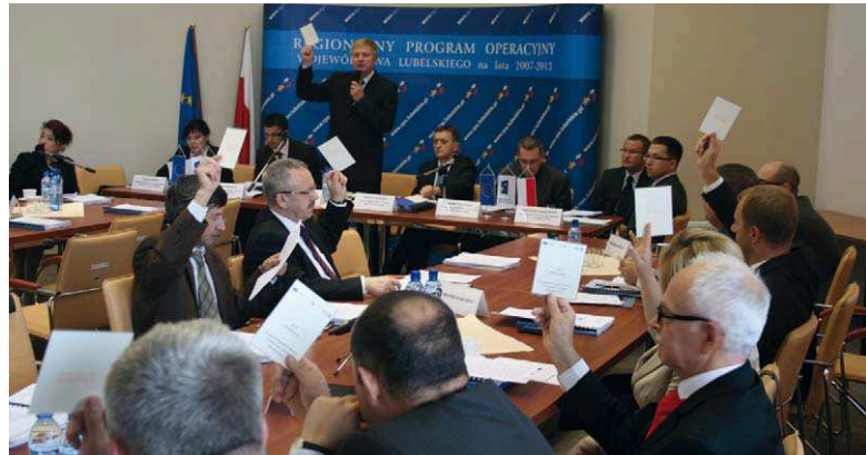
Komitet Monitorujący murem za pomocą dla gminy Wilków

Aby szybciej przekazać gminie fundusze, władze regionu postanowiły o włączeniu tych przedsięwzięć do wykazu projektów kluczowych RPO WL. Do tego, potrzebna była zgoda Komitetu Monitorującego, którą gremium udzieliło jednogłośnie. - Takie rozwiązanie zagwarantuje