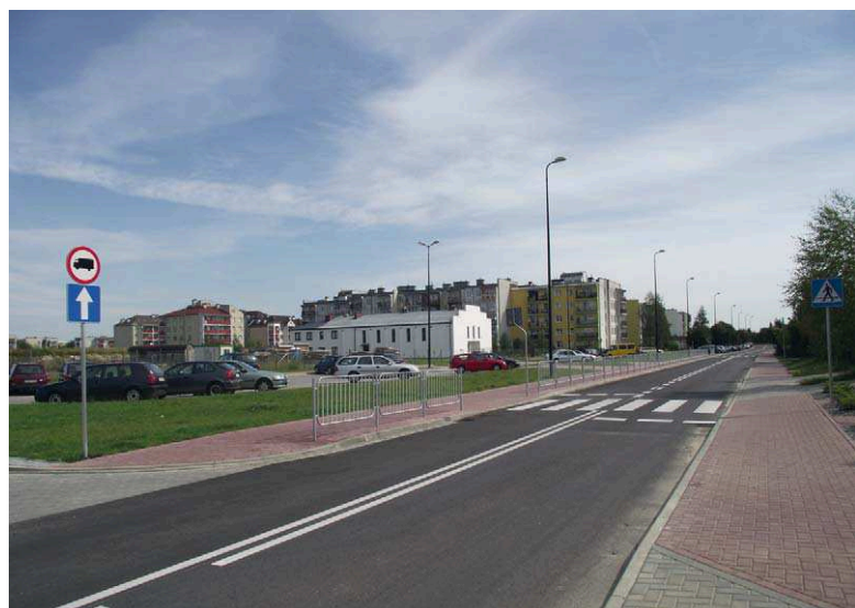
Nowo wybudowana ul. Klonowa - bezpieczna i wygodna

Dzięki środkom unijnym z Regionalnego Programu Operacyjnego udało się pozyskać 1/3 funduszy na budowę nowej ulicy. Pozostałą część pokryło miasto. Łączny koszt inwestycji wyniósł 8,5 mln zł. W efekcie ul. Klonowa zmieniła się nie do poznania. Wybudowano mineralno-asfaltową drogę o długości 958 m i szerokości 12 m z 2 pasami ruchu o szerokości 3 m każdy. Prace objęły również wykonanie chodników, odwodnienia i kanalizacji. Ważnym elementem projektu była budowa i przebudowa 10 skrzyżowań. Przy ulicy powstał także parking z 72 stanowiskami. Kolejne 76 miejsc zosta-