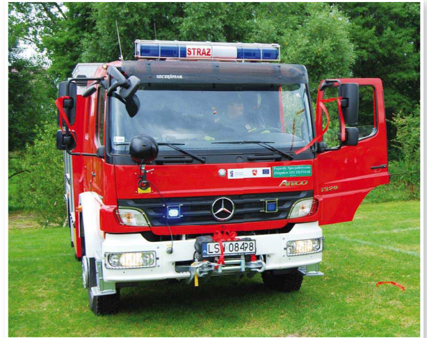
Nowy wóz dla OSP w Oleśnikach