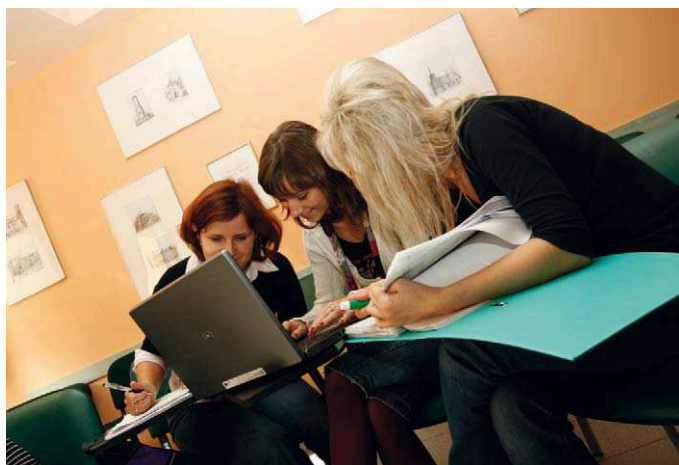
Pisanie projektu może być przyjemne, Foto Mariusz Ogródnik.

Niemal 43 mln zł w ramach Programu Kapitał Ludzki otrzymało województwo lubelskie na realizację projektów indywidualizacji procesu nauczania i wychowania uczniów klas I – III szkół podstawowych w kontekście wdrażania nowej podstawy kształcenia ogólnego, realizowanych w trybie systemowym. Nabór wniosków o dofinansowanie projektów rozpocznie się w listopadzie br.