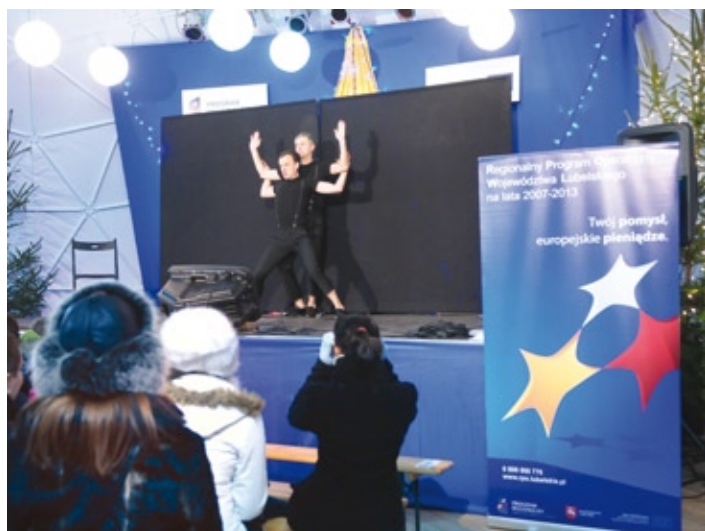
Kabaret „MIMIKA”, czyli śmiech to zdrowie