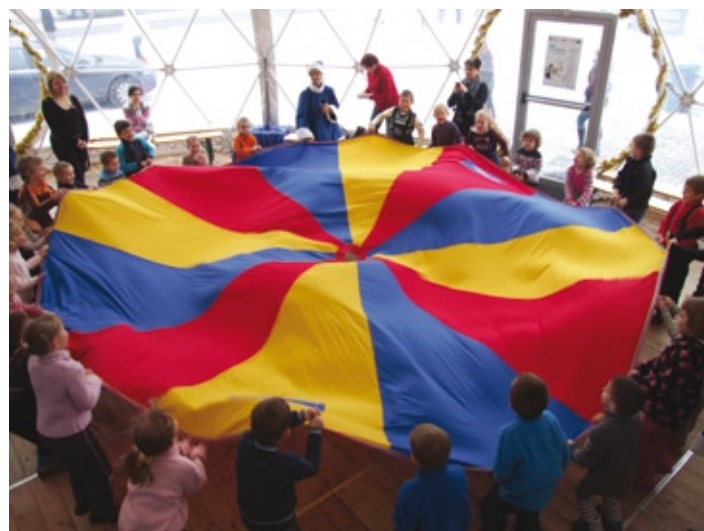
Tak się bawią przedszkolaki