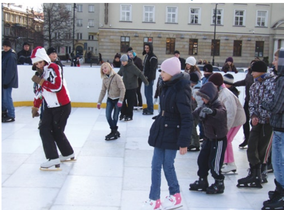
Mistrzowska lekcja jazdy na łyżwach