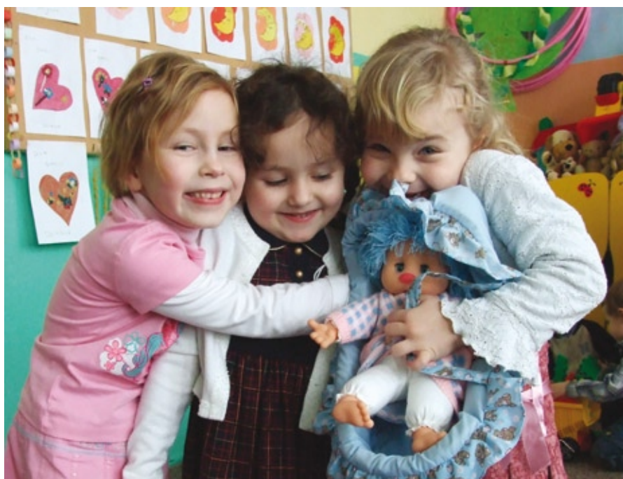
Uśmiech na twarzy dziecka to najmiłsza nagroda, Foto Szkoła Podstawowa w Czerniejowie

Pod koniec lekcji Pan Liczydełko żegna się najpierw z każdym z dzieci: „Bye, bye, it was nice to meet you...” [do widzenia było miło Cię spotkać...], na końcu z całą grupą „Bye”.