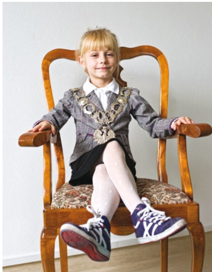
Postawy równościowe można promować już w dzieciństwie

Grzegorz Wenarski Doradca ds. realizacji projektów Regionalny Ośrodek Polityki Społecznej