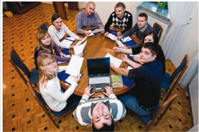
Politechnika Lubelska też korzysta z POKL