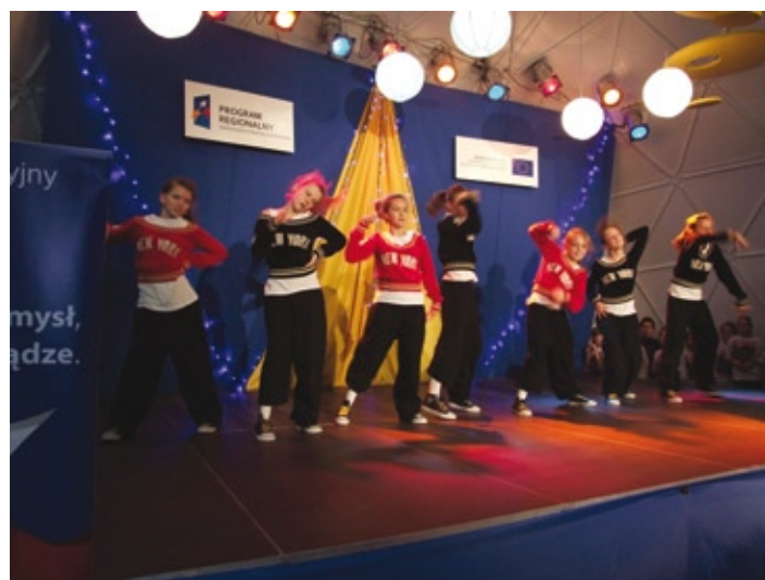
Dzielnicowy Dom Kultury „Bronowice” z Lublina