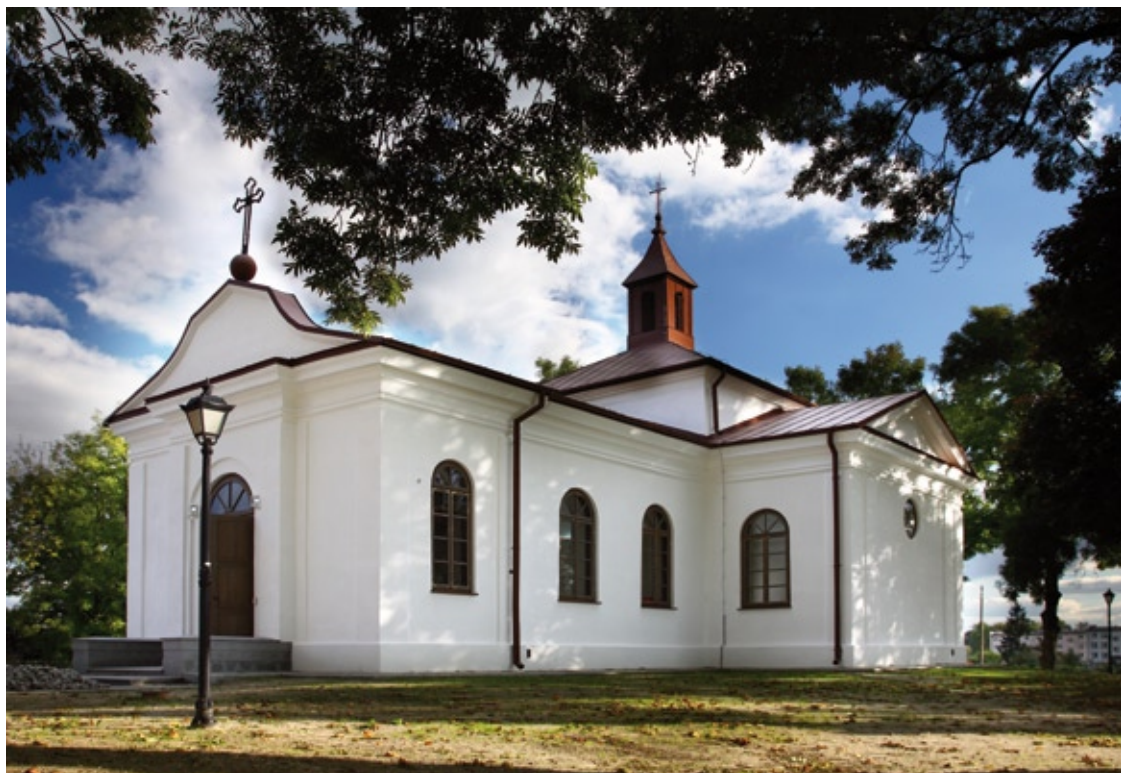
Wyremontowany budynek dawnej cerkwi w Wisznicach stanie się lokalnym centrum kultury

W ramach Regionalnego Programu Operacyjnego kościoły i inne związki wyznaniowe oraz osoby prawne kościołów mogą ubiegać się o środki m.in. na wykonanie prac konserwatorskich, czy też montaż systemu monitoringu oraz zabezpieczenia zabytków i otaczających terenów na wypadek zagrożeń. Dzięki tym funduszom wiele obiektów sakralnych może odzyskać dawny blask i utraconą świetność stając się lokalną atrakcją turystyczną i elementem promocji regionu.