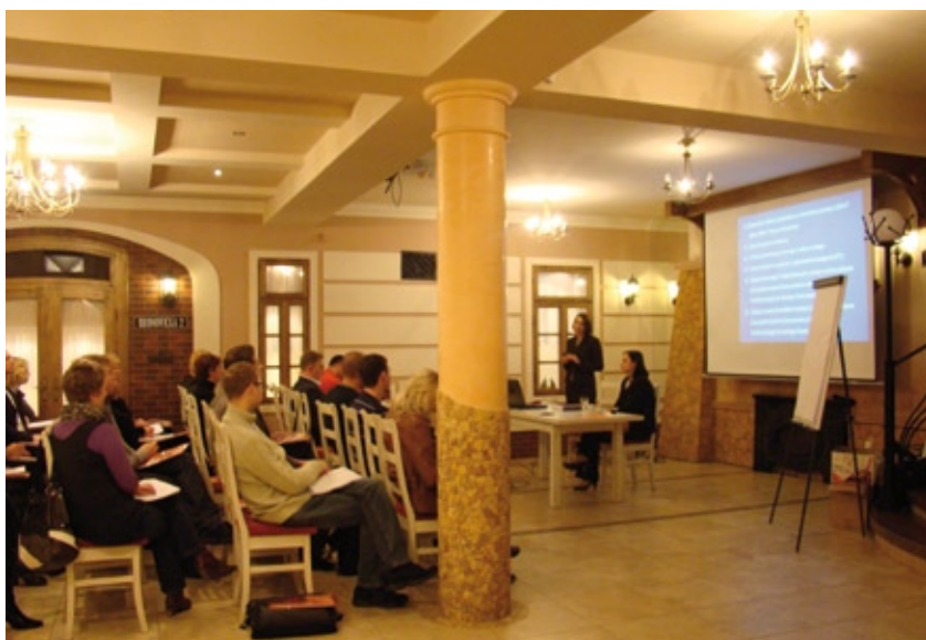
Pełna sala, atrakcyjne miejsce, najlepsi specjaliści. Tak wyglądają szkolenia organizowane przez DSI RR oraz LAW P

Departament Strategii i Rozwoju Regionalnego prowadzi szeroką działalność informacyjną i szkoleniową. Planowane działania wynikają między innymi z zapisów dokumentów tj. „Strategii Komunikacji Funduszy Europejskich w ramach Narodowej Strategii Spójności na lata 2007-2013”, a także Roczno-Planu Działań Informacyjnych i Promocyjnych.