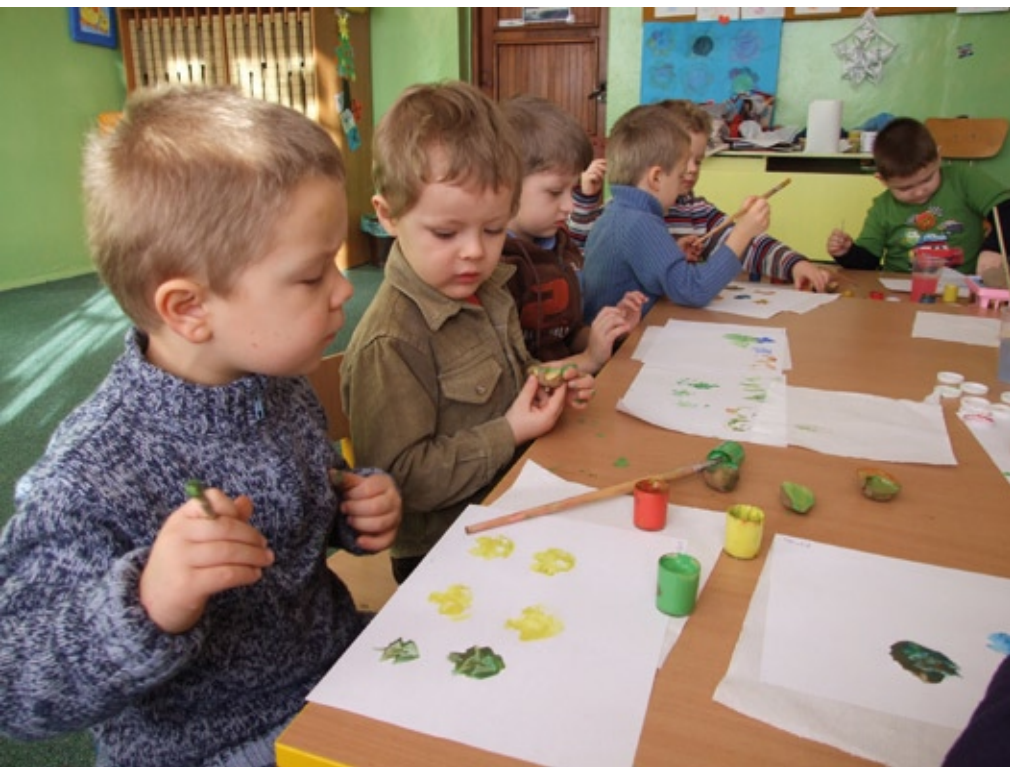
Zajęcia plastyczne, Foto Przedszkole w Czerniejowie