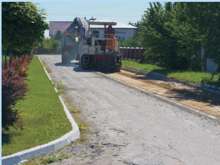
Ulica Szkolna przed remontem

Ulica prowadzi do sali gimnastycznej oraz budowanego kompleksu sportowego.