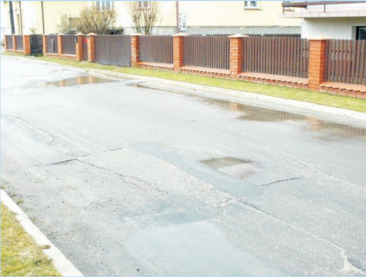
Ulica Parkowa przed remontem

Przebudowano nawierzchnię bitumiczną, zbudowano z lewej strony chodnik oraz zlokalizowano trzy progi zwalniające co znacznie poprawiło bezpieczeństwo użytkowników.