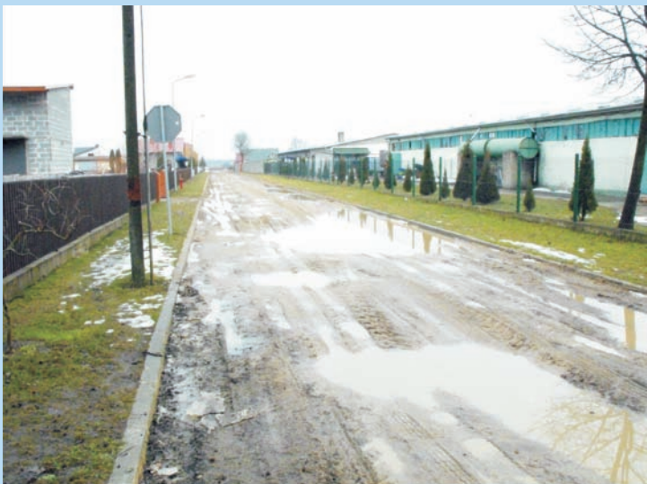
Ulica Słoneczna przed remontem