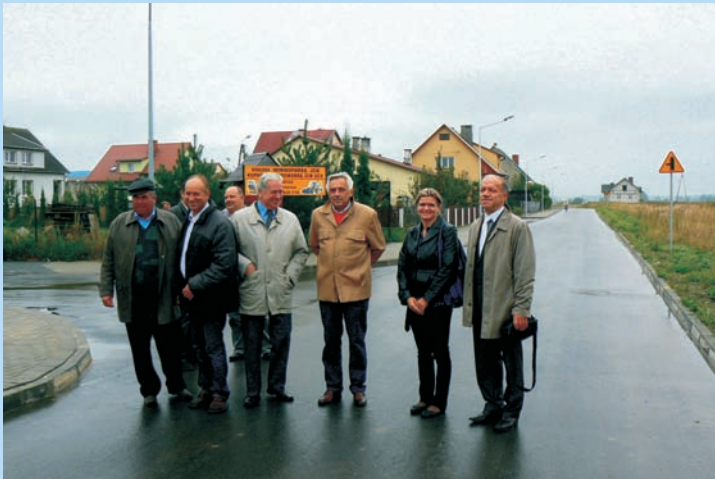
Odbiór pierwszych czterech dróg

W ramach inwestycji wykonano odwodnienie w postaci sieci kanalizacji deszczowej, zjazdy do posesji, założono pasy zieleni. Przy ul. Północnej i Miłej wykonano oświetlenie. Zbudowano kanalizację teleinformatyczną