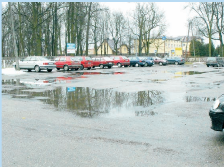
Parking przed remontem