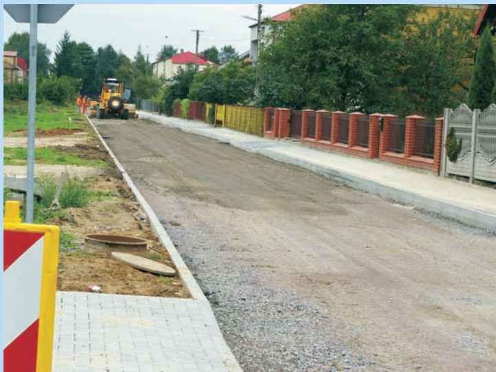
Ulica Rolnicza przed remontem

Przebudowano nawierzchnię i chodnik prawostronny, odwodniono, zbudowano wjazdy do posesji i wykonano pas zieleni.