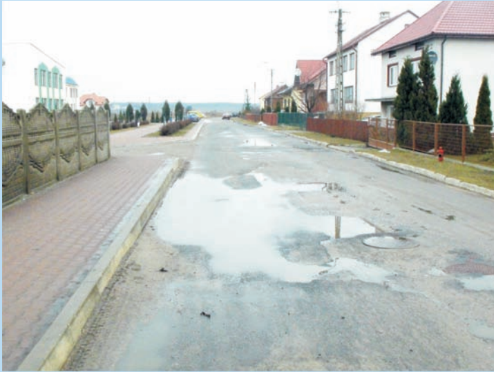
Ulica Nowa przed remontem

Rozpoczyna się od ul. Janowskiej (droga wojewódzka nr 698) biegnie w stronę ul. Północnej, długość ulicy wynosi 437,48 m.