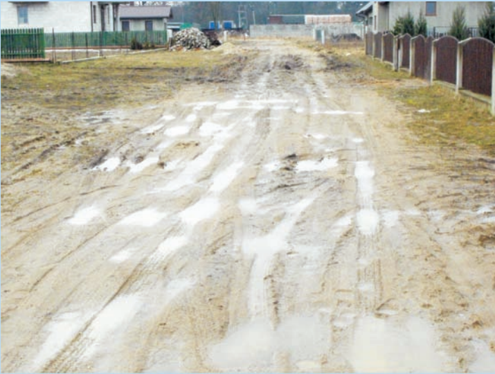
Ulica Miła przed budową

Droga zbudowana od podstaw, ułożona z kostki brukowej, chodnik prawostronny. Zbudowano całą infrastrukturę i wykonano pas zieleni.