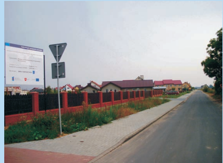
Tablica informująca o inwestycji zlokalizowana przy ulicy Północnej

łązącą budynek Urzędu Gminy przy ul. Kard. St. Wyszyńskiego z budynkiem szkolnym przy ul. Nowej. Zrealizowana inwestycja przyczyniła się do poprawy bezpieczeństwa ruchu w tej części miejscowości Konstantynów jak również poprawiła jej estetykę.