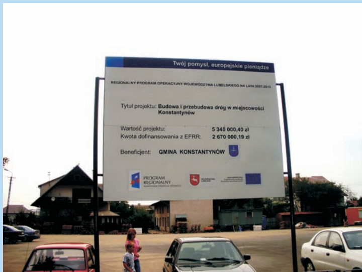
Tablica informująca o inwestycji zlokalizowana na parkingu

Budowa i przebudowa dróg publicznych (gminnych) ulic: Słonecznej, Nowej, Parkowej, Rolniczej, Szkolnej, Północnej i Milej, wraz z budową odwodnienia, oświetlenia i kanalizacji teleinformatycznej w Konstantinowie, współfinansowanego z Regionalnego Programu Operacyjnego Województwa Lubelskiego na lata 2007-2013.