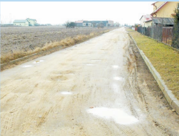
Ulica Północna przed remontem