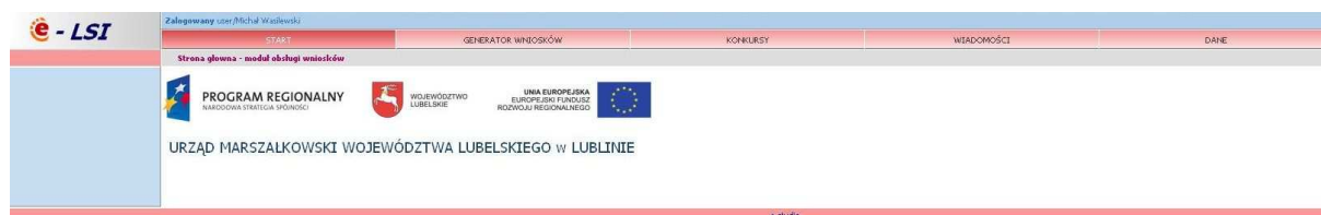
Rys. 4. Wygląd systemu e-LSI po zalogowaniu.

Po poprawnym zalogowaniu się do systemu pojawiają się zakładki umożliwiające beneficjentom wypełnienie wniosków o dofinansowanie i o płatność (Rys. 4.). W ramach e-LSI można także zobaczyć ogłoszone konkursy, zmienić dane beneficjenta, dane osoby wypełniającej wniosek, dokonać zmiany hasła, odczytać informacje od systemu. Widoczne są kolejno od lewej strony zakładki: „START”, „GENERATOR WNIOSKÓW”, „KONKURSY”, „WIADOMOŚCI”, „DANE” oraz „WYLOGUJ SIĘ”.