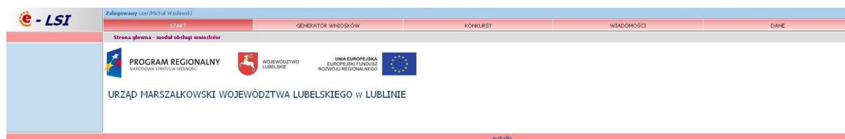
Rys. 4. Wygląd systemu e-LSI po zalogowaniu.

Po poprawnym zalogowaniu się do systemu pojawiają się zakładki umożliwiające beneficjentom wypełnienie wniosków o dofinansowanie i o płatność (Rys. 4.). W ramach e-LSI można także zobaczyć ogłoszone konkursy, zmienić dane beneficjenta, dane osoby wypełniającej wniosek, dokonać zmiany hasła, odczytać informacje od systemu. Widoczne są kolejno od lewej strony zakładki: „START”, „GENERATOR WNIOSKÓW”, „KONKURSY”, „WIADOMOŚCI”, „DANE” oraz „WYLOGUJ SIĘ”.