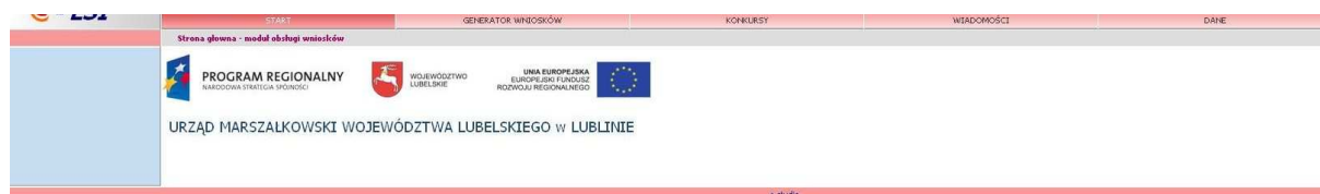
Rys. 4. Wygląd systemu e-LSI po zalogowaniu.

Po poprawnym zalogowaniu się do systemu pojawiają się zakładki umożliwiające beneficjentom wypełnienie wniosków o dofinansowanie i o płatność (Rys. 4.). W ramach e-LSI można także zobaczyć ogłoszone konkursy, zmienić dane beneficjenta, dane osoby wypełniającej wniosek, dokonać zmiany hasła, odczytać informacje od systemu. Widoczne są kolejno od lewej strony zakładki: „START”, „GENERATOR WNIOSKÓW”, „KONKURSY”, „WIADOMOŚCI”, „DANE” oraz „WYLOGUJ SIĘ”.