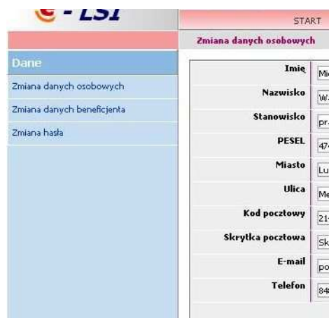
Rys. 6. Podziały wyświetlone w ramach zakładki „Dane”.

W przypadku wejścia na zakładkę „DANE” po prawej stronie ekranu pojawiają się podziały umożliwiające rozszerzenie opcji systemu (Rys. 6.). Występują tam kolejno podziały: „Zmiana danych osobowych”, „Zmiana danych beneficjenta” oraz „Zmiana hasła”. „Zmiana danych osobowych” pozwala na zmianę danych osoby wypełniającej wniosek. „Zmiana danych beneficjenta” pozwala zmienić dane do których przypisywany jest wniosek o dofinansowanie i wnioski o płatność. „Zmiana hasła” pozwala na zmianę hasła dostępowego do konta w www.elsi.lubelskie.pl .