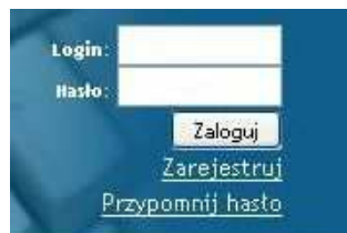
Rys. 3. Pole logowania.

Po wpisaniu tych danych należy kliknąć lewym przyciskiem myszy w przycisk „Zaloguj” (Rys 3.).