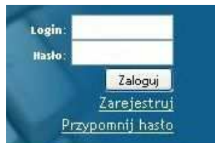
Rys. 3. Pole logowania.

Po wpisaniu tych danych należy kliknąć lewym przyciskiem myszy w przycisk „Zaloguj” (Rys 3.).